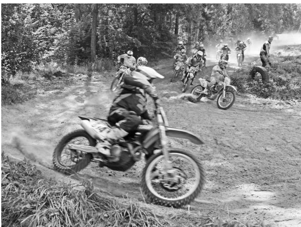
На трассе - ветераны.