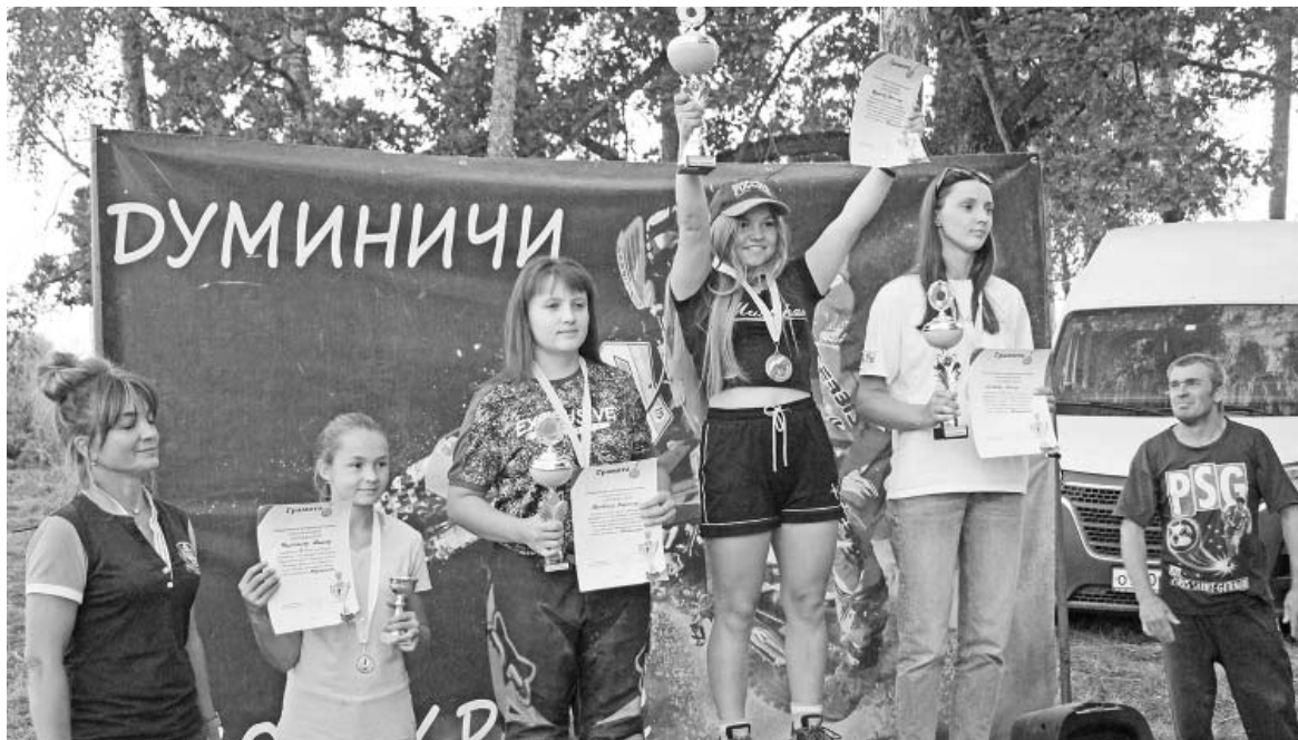
Отважные и милые девушки.

В прошлую субботу в Думиничах успешно прошел традиционный мотокросс, посвященный освобождению района от немецко-фашистских захватчиков. На трассе собралось 75 спортсменов из разных регионов, вплоть до Сахалина.