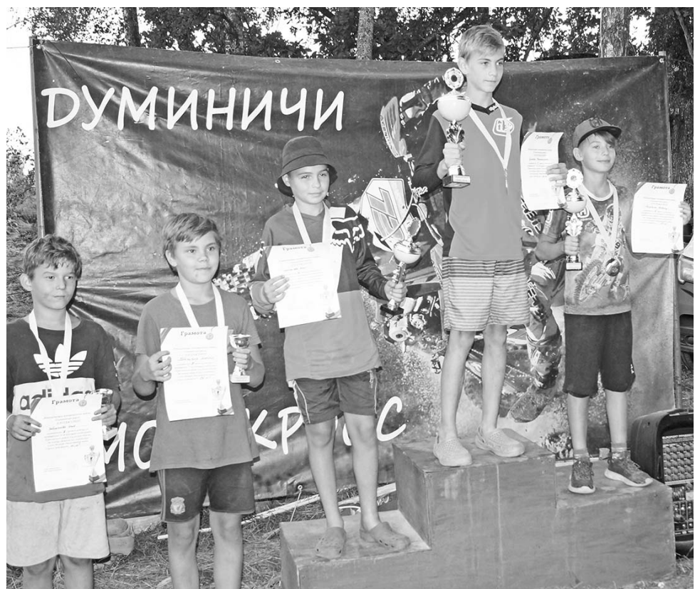
Призеры в классе 85 куб.см